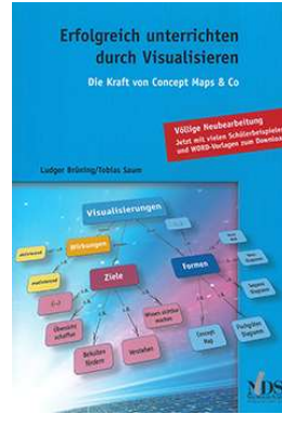
Erfolgreich unterrichten durch Visualisieren