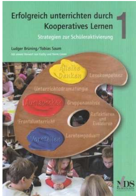
Erfolgreich unterrichten durch Kooperatives Lernen Band 1