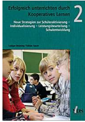
Erfolgreich unterrichten durch Kooperatives Lernen Band 2