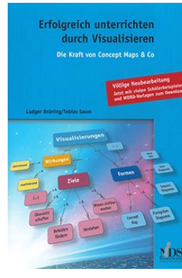
Erfolgreich unterrichten durch Visualisieren