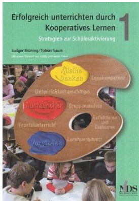
Erfolgreich unterrichten durch Kooperatives Lernen Band 1