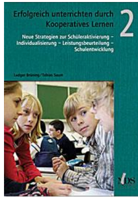
Erfolgreich unterrichten durch Kooperatives Lernen Band 2